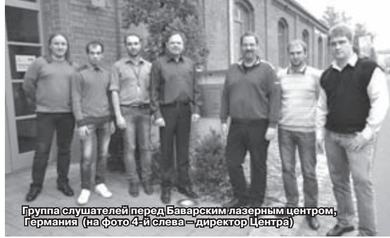
Группа слушателей перед Баварским лазерным центром, Германия (на фото 4-й слева – директор Центра)

В городе Радужном любой школьник-старшеклассник объяснит приезшему устройство газового и твердотельного лазера, а каждый пятый при этом продемонстрирует в действии лазерную указку, правда, китайского производства. А вот сведения о создании мощных волоконных лазеров уже относятся к охраняемым НОУ-ХАУ. На сегодняшний день лишь немногие фирмы мира могут делать волоконные лазеры, и то мощностью в сотню-другую ватт, нужны же такие лазеры мощностью десятки киловатт. В них остро нуждается промышленность, без них невозможны новейшие разработки. Словом, России нужны лазеры нового поколения и мы должны научиться их делать.